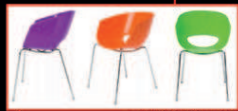
ORBIT ARMCHAIR Designerstuhl in diversen Farben