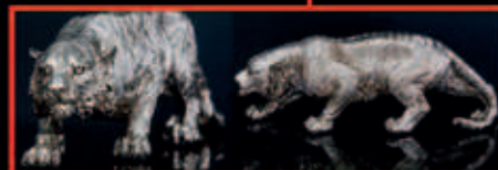
TIGER im Antik Silber look