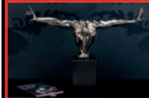
SKULPTUR ATHLET Sockel aus Marmor 75 cm erhältlich in rot und silber