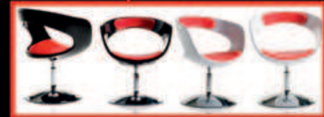
GAMBLER Dreesessel in diversen Farben